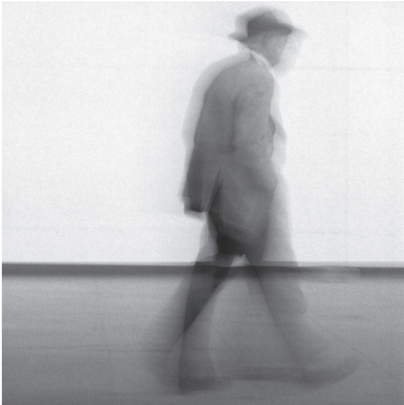
Eppur si muove #27, Sevilla 2018