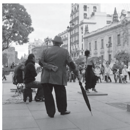
Escena #43, 2016

This exhibition contains more than 250 photographs that are tokens of the artist's vast archive. The scenes emerge from his daily travels through the city,