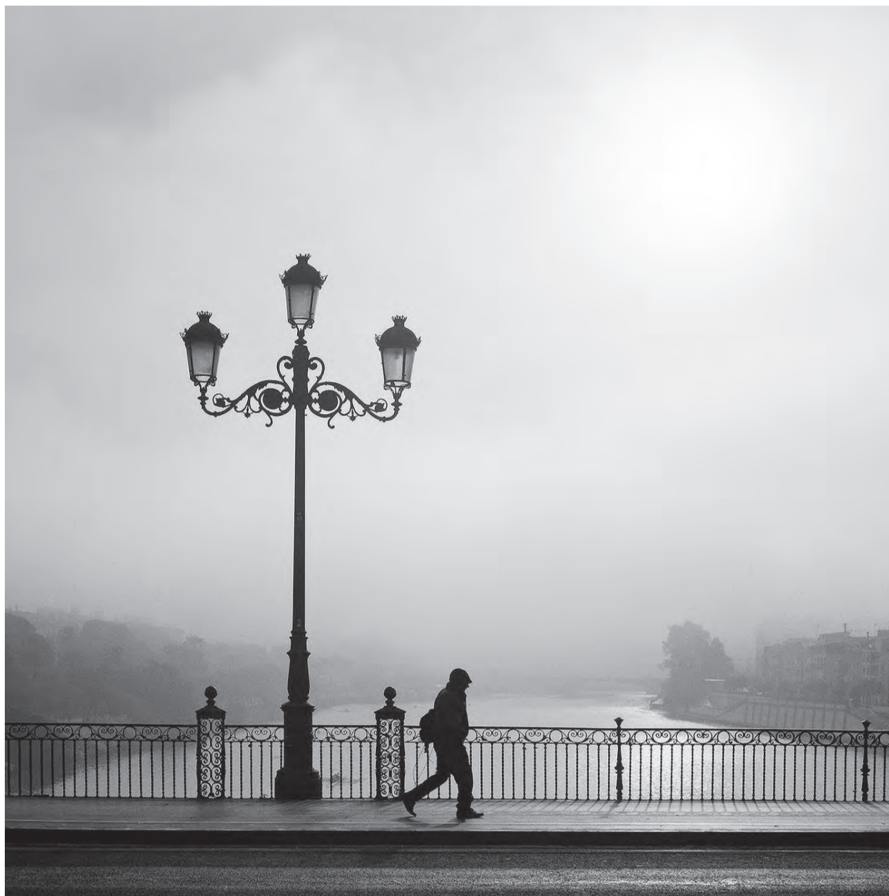
Escena #74, Sevilla 2018