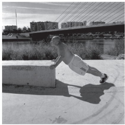
Escena #23, 2016

Nunca antes se han producido tantas imágenes: hay datos que afirman que en las redes sociales se comparten casi un millón de fotos cada segundo. Un torrente de imágenes que nos está dejando ciegos porque solo podemos ver ya a través del ojo de nuestras cámaras digitales. Y en cualquier caso, el problema no es tanto por la sobreproducción de imágenes como por la escasez de lecturas críticas, y pausadas, sobre ellas. No es tanto un problema tecnológico como de alfabetización visual.