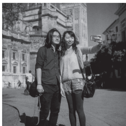
Catedral #13, 2014

the result of an ironic gaze not devoid of humour. As mentioned, these scenes captured by the strolling photographer are a fine exercise to understand his work as a place where we may emphasise our ability to learn from images, and this selection is an invitation to seek out new stories. From other scenes.