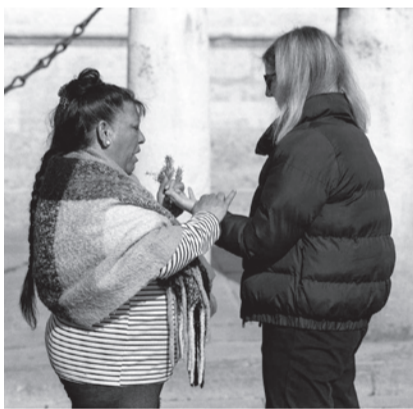
Romero y buenaventura #2, 2018

grafo paseante son un buen ejercicio para entender su trabajo como lugar donde poner en valor la capacidad que tenemos para aprender de las imágenes, y una invitación a la búsqueda de más historias. De otras escenas.