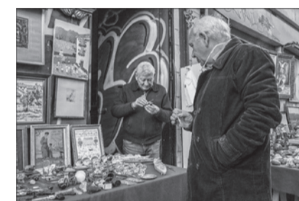
El Jueves #30, 2018

Feast in Time of Plague (video HD, 16:9, 9 min.) is a film that forms a part of The Street Developed and Revealed , made up of travelling shots produced on his bike at the Seville Fair. We may establish an analogy with the play of the same name written by Alexander Pushkin in 1830: in an urban setting and in view of the plebs decimated by the plague, a group of aristocrats, clergymen, members of the bourgeoisie and top civil servants pay tribute to their deceased friends, also affected by the lethal plague, flaunting their wealth and privileges; a world coming to its end to which they try to cling through traditions and the pleasure of the senses. The photographs in The Silent Fair complement the video: ephemeral architectures found in towns and villages, erected in areas where they coexist with spaces concentrating traditions and amusements that are displayed ostentatiously.