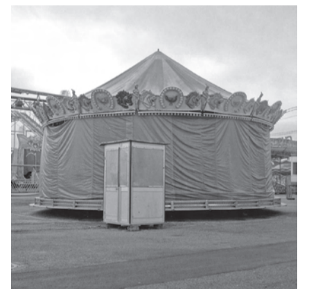
La feria silenciosa #32, 2017

popular mercadillo que en el momento de escribir este texto está amenazado por un intento de «regulación» municipal) sino la mirada urgente a diferentes conceptos que señalan estas imágenes: Mercado - Producto - Consumo - Reutilización - Basura - Crisis - Fiebre. El uso del color aporta una nueva capa de sentido dramático: hemos dado la espalda a la naturaleza y con ello nos hemos dado la espalda a nosotros mismos, hemos producido tanto que solo nos queda la reutilización de la basura, hemos tenido tantas crisis que la fiebre ya no es un síntoma de lucha sino una llamada de atención sobre lo que viene.