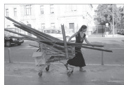
Bienestar S.A. #45, 2016

the limits of ecclesiastical territory and preventing merchants and their horses from entering and sitting in the temple. Nobody ever believed that this laconic struggle to make sure money wasn't discussed in churches. Nowadays, entering the cathedral equipped with an audio guide costs € 12. Tourism reigns supreme; the merchants are inside. In José Luis Tirado's Cathedral collection, tourists are anonymous subjects captured just as they are taking their snapshots in front of the Giralda, or kneeling down by the statue of the Pope. In contrast, palm-readers and fortune-tellers, coachmen and their horses, are treated as the truly important characters around the temple. The buskers who pass their hats around are equally as prominent in the Street Artists collection. Once again, he develops and reveals the invisible, providing it with faces and names.