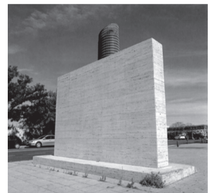
Paisaje urbano #31, 2016